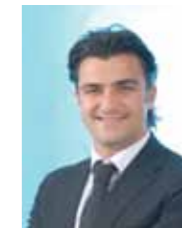
Alfonso Cammarata Capogruppo "Il Popolo della Libertà"