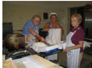
Volontarie del Centro Polivalente "Ornello Pederzoli" di Limidi

Sabato 10 settembre, tradizionale e partecipatissima festa di fine estate presso la Casa Protetta Pertini. Il giardino della struttura si è trasformato in un'area conta-