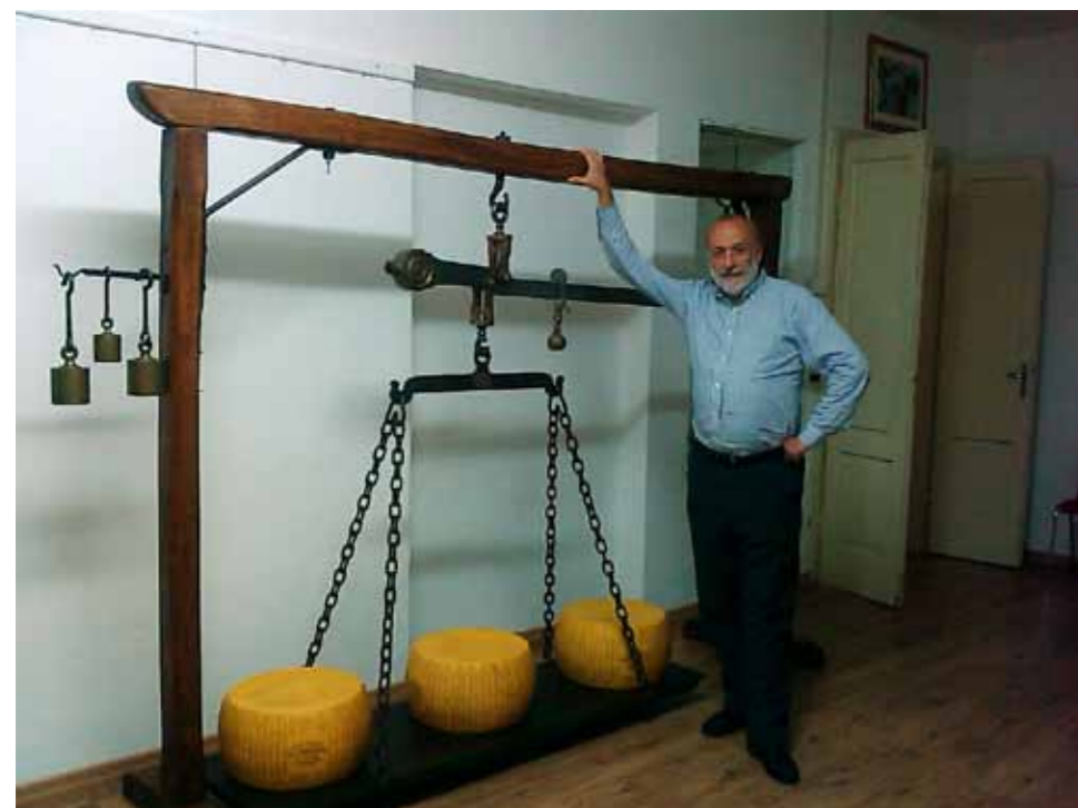
Carlo Petrini, presidente SlowFood in visita all'esposizione del Museo a Vas (Belluno) in occasione dell'iniziativa "Il peso della Piazza", domenica 11 settembre 2011

Il programma completo su www.museodellabilancia.it , tel 059 527133