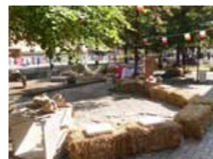
Sopra: il giardino della Casa Protetta