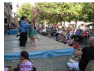
Sopra: i ballerini. A sinistra: alcune delle volontarie che hanno reso possibile il buon esito della festa