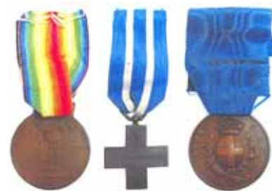
1° da sinistra: Medaglia interalleata della vittoria; 2° Croce al merito di guerra; 3° Medaglia di bronzo al valor militare.

L'ufficio memoria c/o biblioteca è a disposizione - tel. 059/526176 e mail: memoria@comune.campogalliano.mo.it