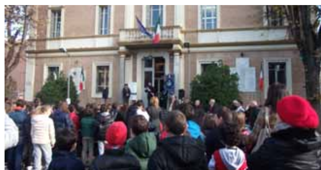
Celebrazione 4 novembre 2012