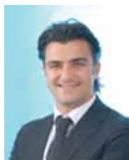
Alfonso Cammarata Capogruppo "Il Popolo della Libertà - Forza Italia"