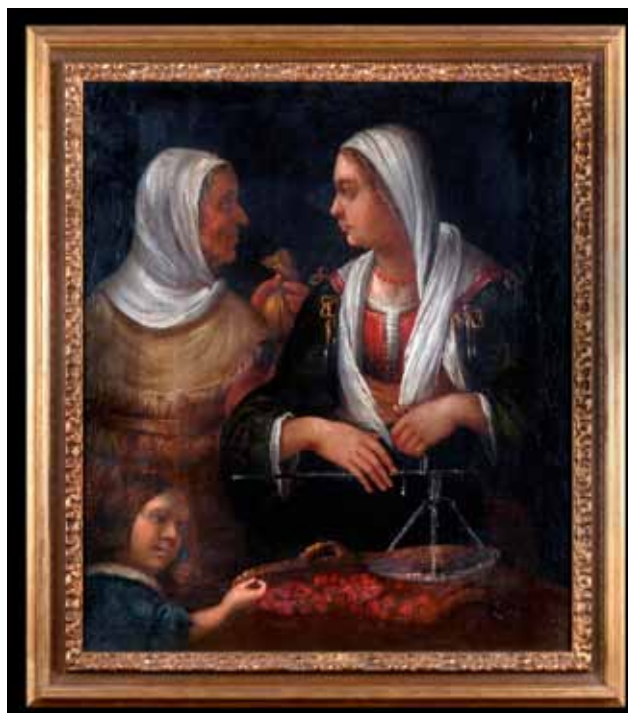
Autore ignoto, Venditrice di ciliege, ambito lombardo emiliano, 1630-1640. Dono della ditta Gibertini Elettronica di Novate Milanese (MI)

Il nuovo allestimento, che consente di valorizzare parte del patrimonio senza sostenere spese aggiuntive, offre anche a chi conosce già il museo l'occasione per tornare, magari assieme a familiari ed amici ospiti durante le festività natalizie: il Museo (ricordiamo che l'ingresso è gratuito per i residenti e ridotto per i loro ospiti) è aperto dalle 10 alle