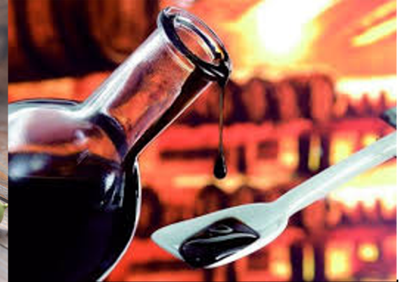
Miglior Aceto Balsamico