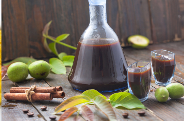
Miglior Nocino di famiglia