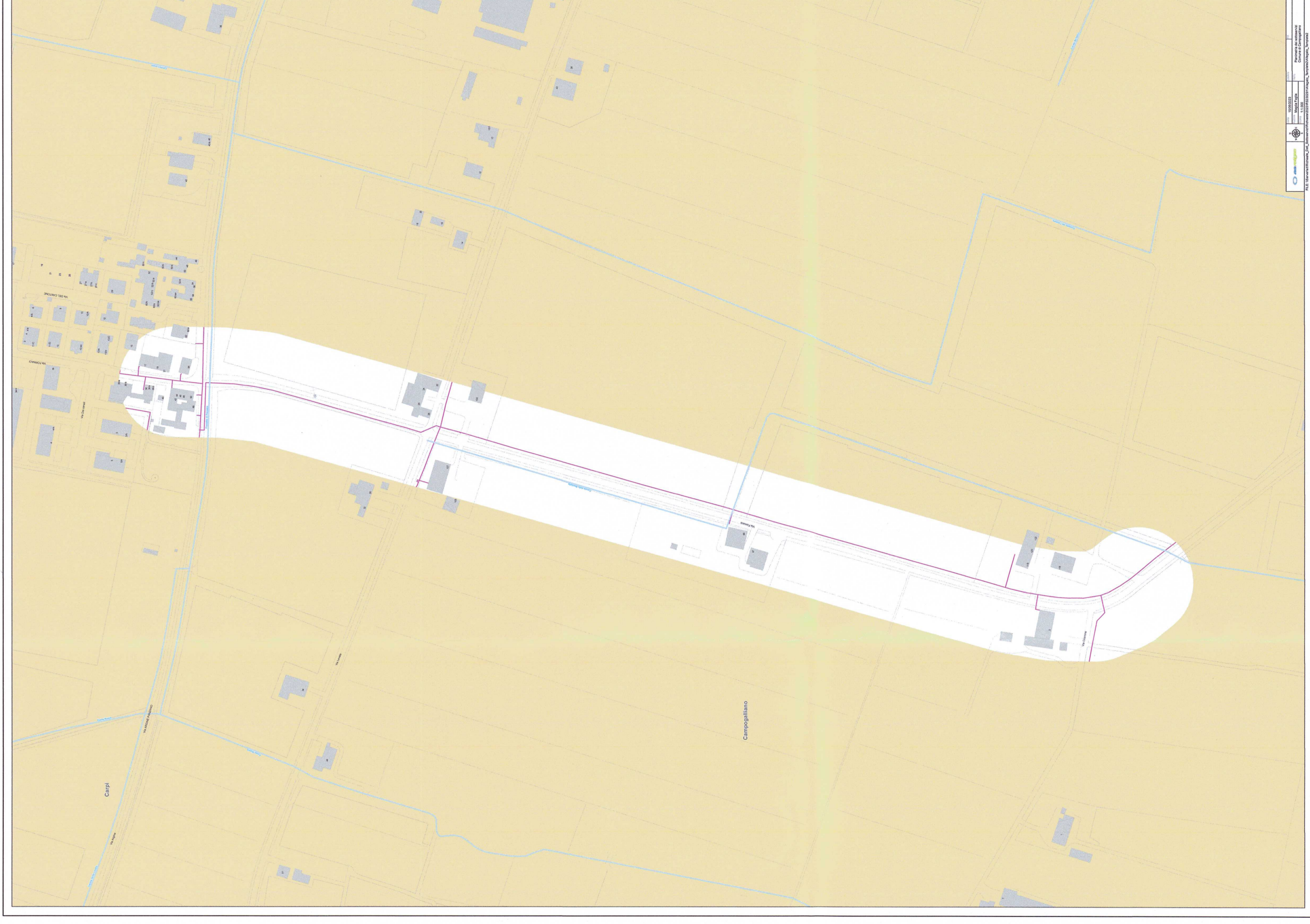
VIA FORNACE - Tracciato sottoservizi AsRetigas