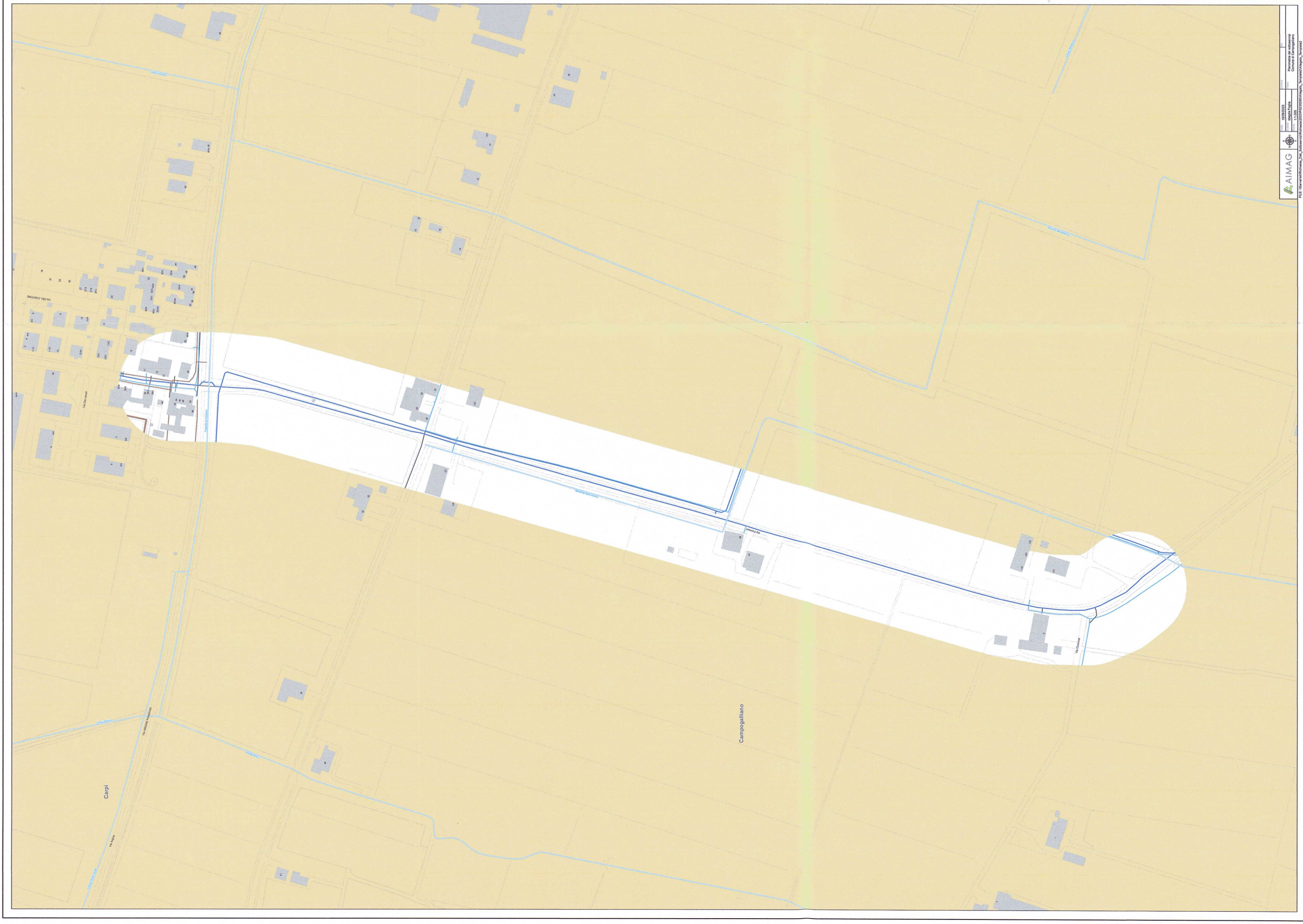
VIA FORNACE - Tracciato sottoservizi Aimag