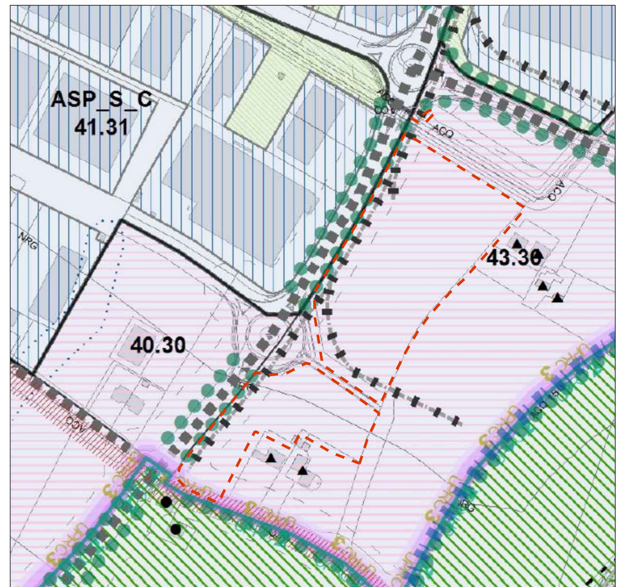
CARTA UNICA DEL TERRITORIO scala 1:2000