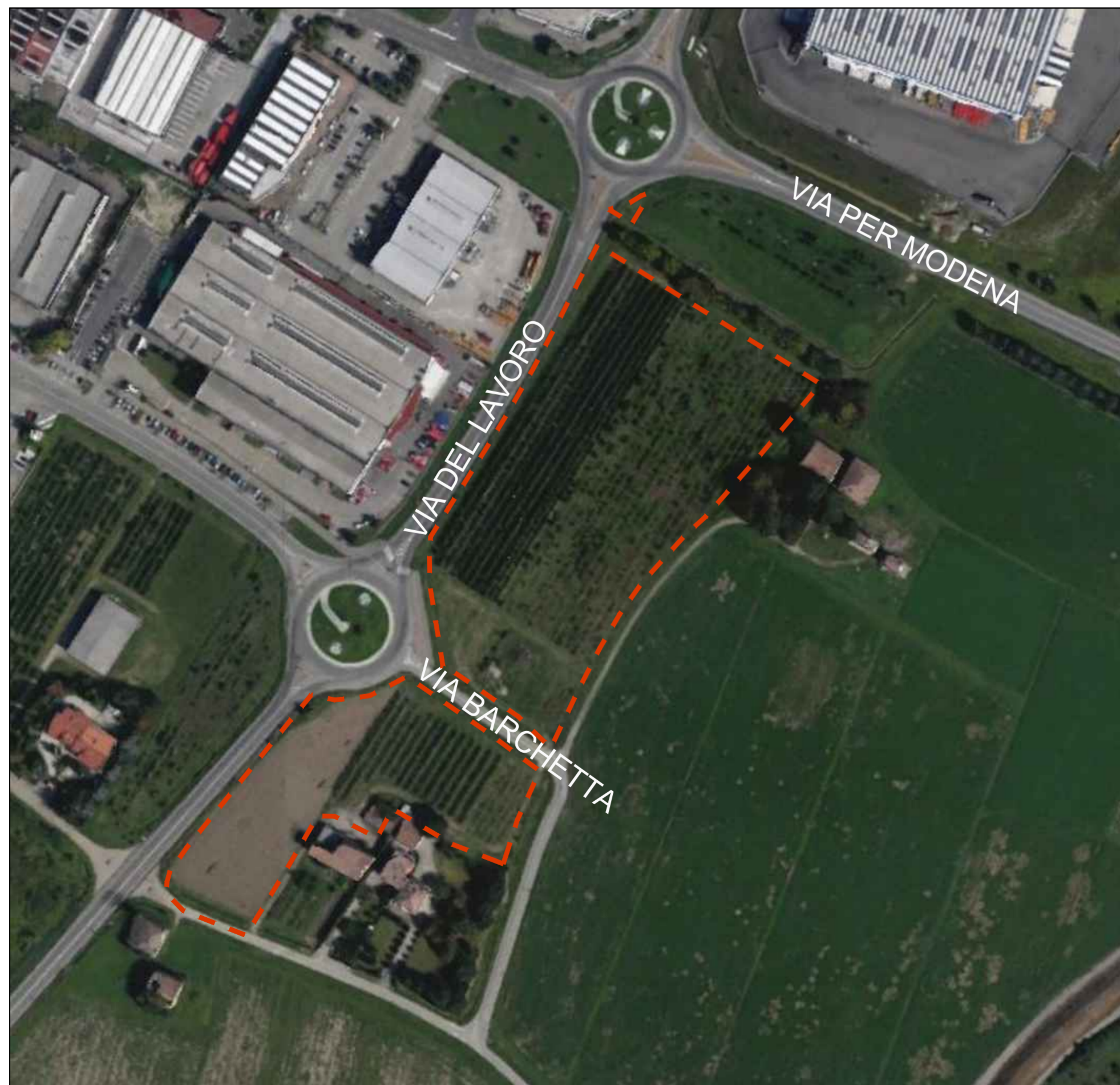
VISTA AEREA scala 1:2000