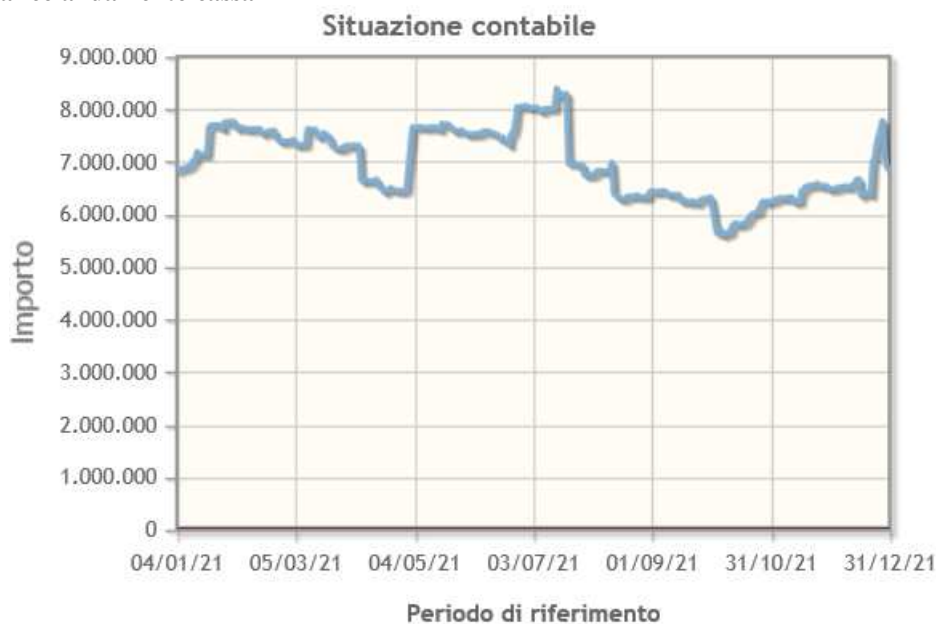
Tabella 2 – grafico andamento cassa

L'esercizio 2021 si conclude con un risultato finanziario positivo pari a complessivi euro 5.567.511,85.