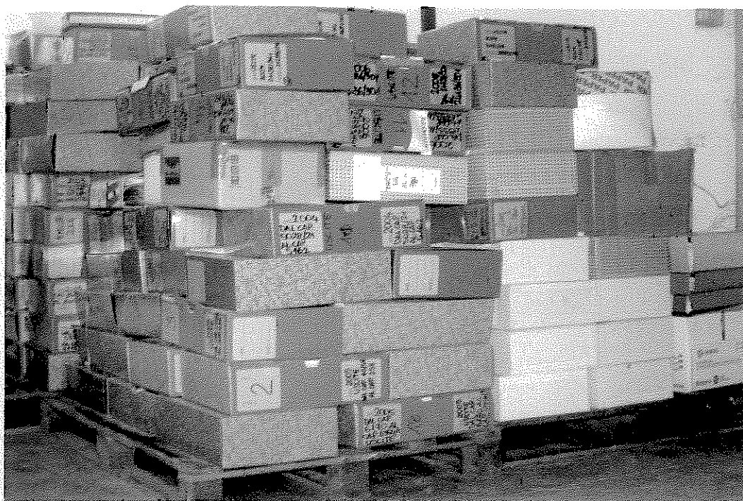
Luglio 2014: l'imponente versamento di documentazione effettuata nella stessa area dell'archivio dove erano stati terminati, da poche settimane, i lavori di sgombero e riordino.