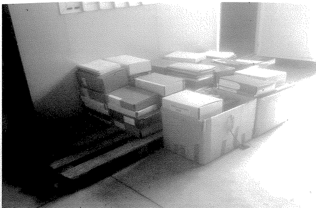
Giugno 2014: la documentazione rimanente da riordinare.