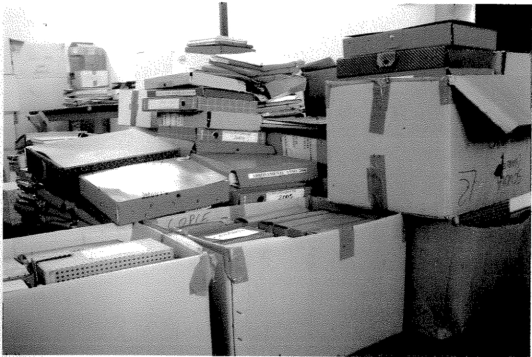
Aprile 2014: l'archivio dopo le prime fasi di riordino e altri successivi versamenti.