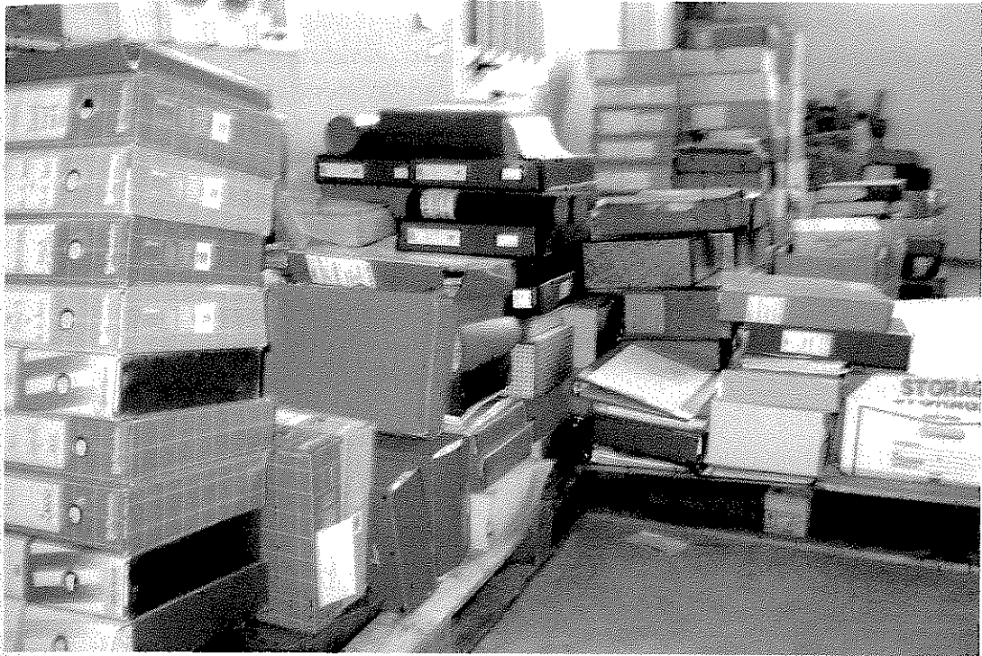
Ottobre 2014: la documentazione versata, dove sono tuttora in corso le operazioni di riordinamento, da terminare entro l'anno 2014.