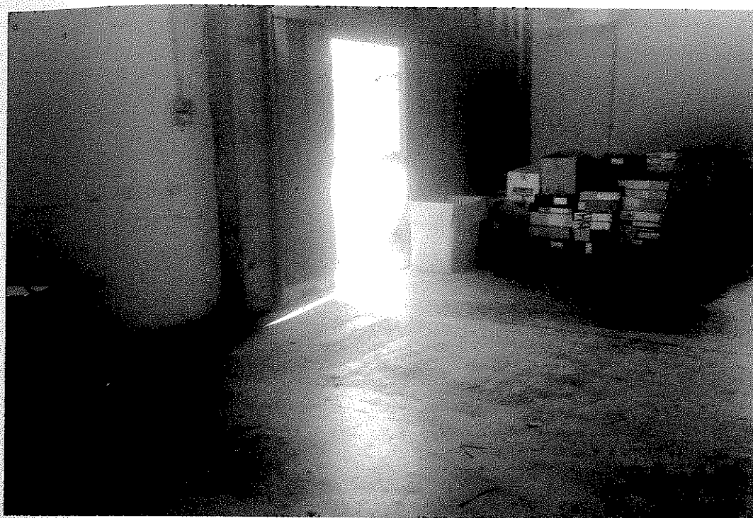
Giugno 2014: l'archivio (zona di accesso) dopo le prime operazioni di riordino.