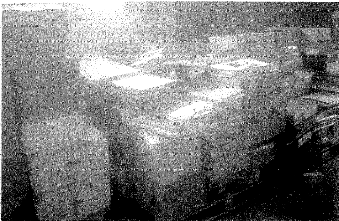
L'archivio (zona di accesso) all'avvio dei lavori di riordinamento, dopo i versamenti di documentazione effettuati nel 2013 e all'inizio del 2014.