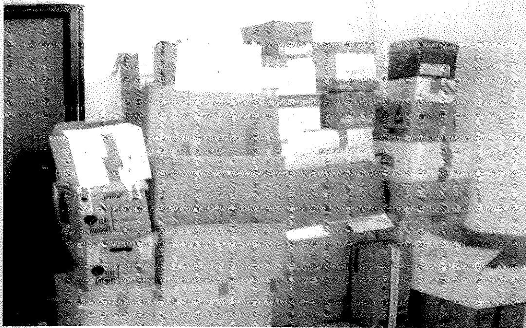
Settembre 2014: lo scarto già preparato per l'avvio delle procedure di eliminazione.