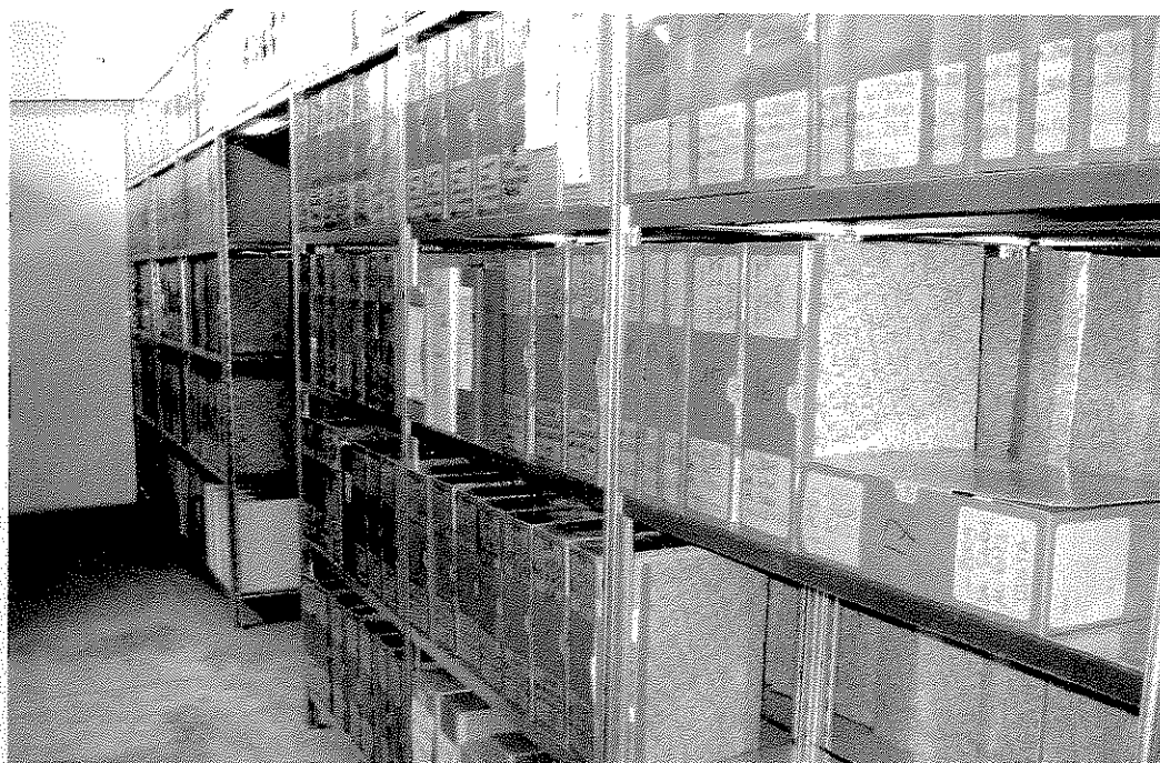
Settembre 2014: la documentazione riordinata e posizionata sulle relative scaffalature.