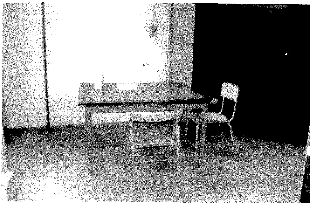
Settembre 2014: la stessa area dell'archivio liberata dalla documentazione, che è stata riordinata e posizionata sugli scaffali.